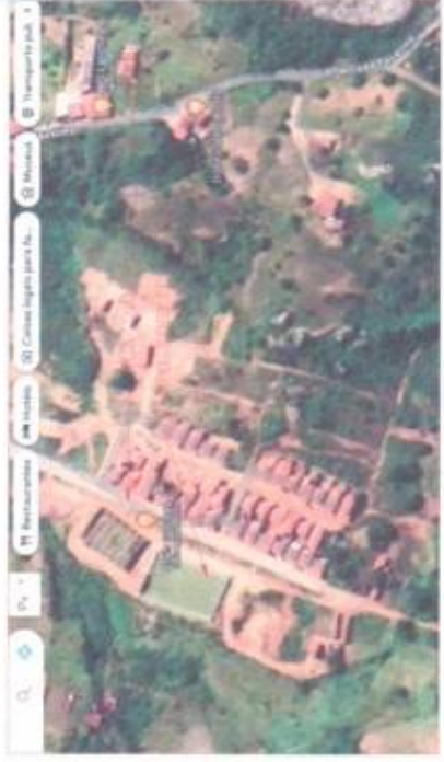
PLANTA DE LOCAÇÃO -----1/1000